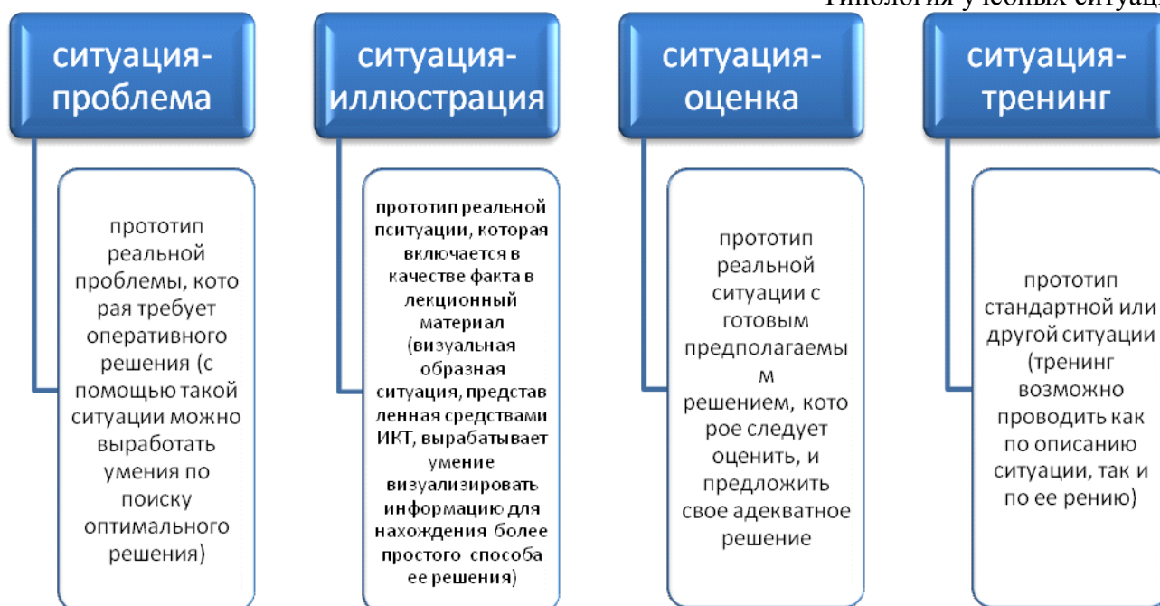
Схема 1. Типология учебных ситуаций.

Развитию регулятивных универсальных учебных действий способствует также использование в учебном процессе системы индивидуальных или групповых учебных заданий, которые наделяют учащихся функциями организации их выполнения: планирования этапов выполнения работы, отслеживания продвижения в выполнении задания, соблюдения графика подготовки и предоставления материалов, поиска необходимых ресурсов, распределения обязанностей и контроля качества выполнения работы, – при минимизации пошагового контроля со стороны учителя. Примеры такого рода заданий: подготовка спортивного праздника (концерта, выставки поделок и т. п.) для младших школьников; подготовка материалов для внутришкольного сайта (стенгазеты, выставки и т. д.); ведение читательских дневников, дневников самонаблюдений, дневников наблюдений за природными явлениями; ведение протоколов выполнения учебного задания; выполнение различных творческих работ, предусматривающих сбор и обработку информации, подготовку предварительного наброска, черновой и окончательной версий, обсуждение и презентацию.